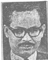
Senator Abu BAKAR Hamzah

Rundingan itu juga adalah sebagai langkah permulaan dan persediaan bagi mengadakan satu rundingan rasmi di Kuala