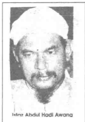
Ustaz Abdul Hadi Awang