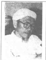
USTAZ NIK HAJI ABDUL AZIZ

huruf yang sudah bertapak besar dalam politik negara. CCC dipinda namanya tetapi masih mengekalkan nama pendek tiga huruf 'C' itu, iaitu 'Communities Coalition Congress' atau Kongress Gabungan Masyarakat (yang berbilang kaum).