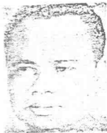
غفار دان اکن برینچغ

توکس؟ ایت ترماسوق مپاوا لبه رامی بسومیترا برکجیمفوع دالم بیدغ فرداکن دان فراوسهان، منکیانکن کلس کماجوان مشارکه سفای لبه پابق لاتیهن کرج دجالکن، موفوق صماغه کوتسوخ رویوغ، بردیکاری دان رنجانن کجیل دلوار بندر. "دالم توکس؟ یغ بسره ایت، سیناتور ابو بکر اکن منولغ سای تراواتام دری سکی اکام سفای سسوا رنجاشن فبشون گسترین برجالن لنجر، تکس."