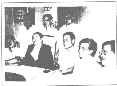
Barisan pimpinan baru CCC dalam sidang akhbar di sebuah restoran baru-baru ini

Mereka yakin, negara Islam yang diperjuangkan oleh PAS adalah lebih baik dari negara Islam yang dilaungkan oleh UMNO sekarang ini.